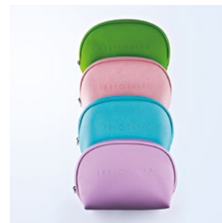
КОСМЕТИЧКА СРЕДНЯЯ, ЦВЕТА В АССОРТИМЕНТЕ