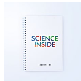
БЛОКНОТ ДЛЯ КОСМЕТОЛОГОВ