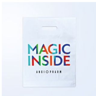
ПАКЕТ ПВД РАЗМЕР: 30X40 CM