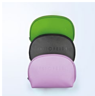
КОСМЕТИЧКА БОЛЬШАЯ, ЦВЕТА В АССОРТИМЕНТЕ