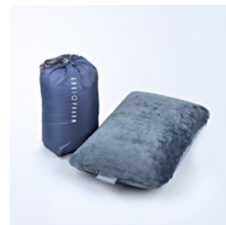
ПОДУШКА С ЭФФЕКТОМ ПАМЯТИ