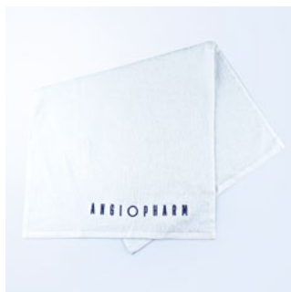
ПОЛОТЕНЦЕ ПЛОТНОСТЬ: 500 ГР/М2 РАЗМЕР: 40X70 CM