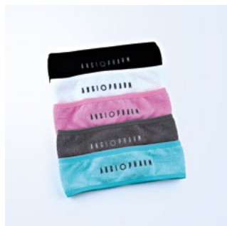
КОСМЕТИЧЕСКАЯ ПОВЯЗКА ЦВЕТА В АССОРТИМЕНТЕ