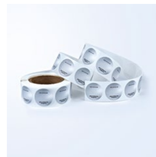
СТИКЕР «ДАТА ОТКРЫТИЯ»