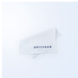
ПОЛОТЕНЦЕ ПЛОТНОСТЬ: 500 ГР/М2 РАЗМЕР: 30X30 CM